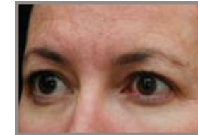
ANTES DE THERMAGE