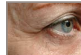
ANTES DE THERMAGE