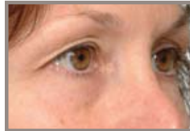
ANTES DE THERMAGE