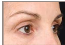
QUINCE MESES DESPUÉS DEL TRATAMIENTO