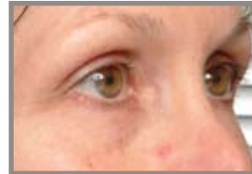
SEIS MESES DESPUÉS DEL TRATAMIENTO