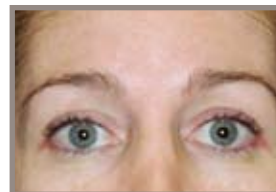
DOS MESES DESPUÉS DEL TRATAMIENTO