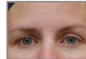
ANTES DE THERMAGE