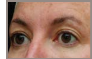
CUATRO MESES DESPUÉS DEL TRATAMIENTO